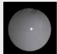
klares, transparentes Auge